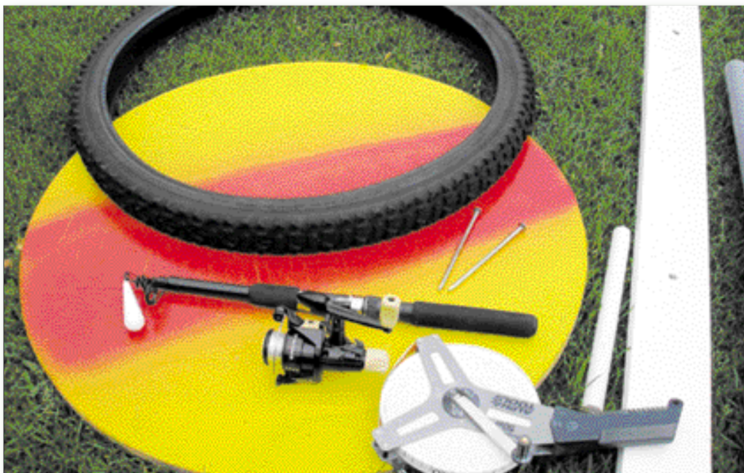
Hilfsmaterial für Übungseinheiten zum Zielwerfen beim Binnenfischen. Eine markierte Holzplatte oder ein Fahrradreifen Größe 26 oder 28, Abwurf Brett ca. 1,5 m lang, Maßband 25m, Rute, Rolle mit 0,20 monofiler Schnur und ein 18 g Gewicht.