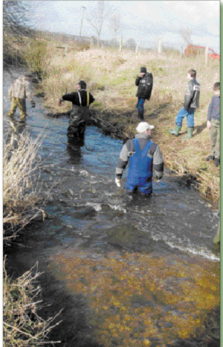
Das neue Laichbett hier im Vordergrund ist in der Sonne sehr gut zu erkennen.

Der Arbeitsaufwand wurde mit etwa 150 Stunden angegeben. Ein befreundeter Landwirt unterstützte uns tatkräftig indem er sich um das Anliefern des Feinkies kümmerte und uns eine Anhängerladung Feldsteine schenkte. Geröll und Feinkies kosteten 358 €.