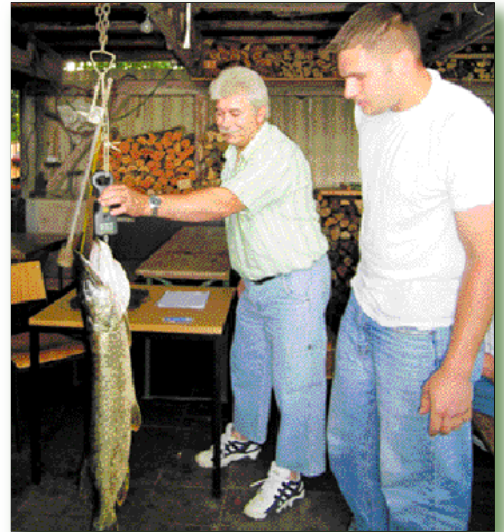
Der größte Hecht des Gästefischens des Sportfischervereins Plön und Umgebung wog stolz 7.800 Gramm.

Die positive Stimmung der Angler spiegelte sich dann auch beim anschließenden Schluenseefest wieder. Etwa 150 Gäste und Freunde des Vereins fühlten sich an Ufer des Sees sehr wohl, genossen sie doch die von Vereinsmitgliedern zubereiteten gebratenen und geräucher-