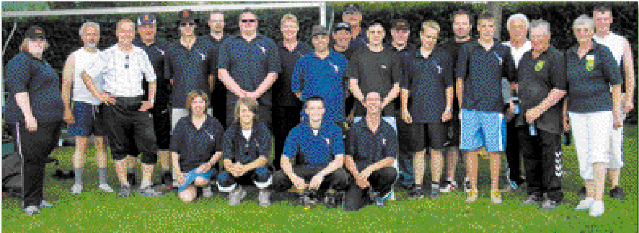
Gruppenfoto der Teilnehmer aus Schleswig Holstein

Kassel – Bei hochsommerlichen Temperaturen trafen sich die Turnierwurfsportler im Binnenfischen (BF) und Meeresfischen (MF) aus allen Landesverbänden zur diesjährigen Deutschen Meisterschaft in Kassel. Wer konnte, verharrete bis zu seinem „Auftritt“ im Schatten. Jede leichte Brise wurde zum Abkühlen genutzt. Leid taten einem die Schiedsrichter, die auf den Starbahnen trotz der brennenden Sonne ihren Job hervorragend machten.