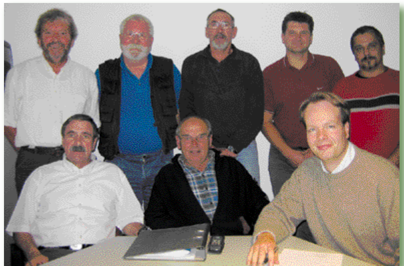
Die Arbeitsgruppe, die sich mit der Zukunft der Fischereischeinprüfungen auseinandersetzt ist sehr aktiv.

Die Praxis, Lehrgänge überwiegend in der kalten Jahreszeit abzuhalten, sollte auch auf die „Urlaubszeit“ ausgedehnt werden. Familien, Väter und Kinder, Großeltern und Enkel haben speziell in diesen Monaten zusammen Zeit. Hier flexibel Lehrgänge anzubieten ist mit Sicherheit „kundenfreundlich“. Andererseits haben aber unsere Ausbilder natürlich auch einen Anspruch auf eigenen Urlaub. Für solche Fälle ist über Möglichkeiten einer landesweit operierenden „Ausbildungsfeuerwehr“, die in Abstimmung mit den zuständigen Koordinatoren der Kreise eingesetzt werden kann,