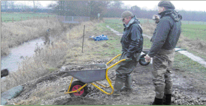
Kaum Pausen: Mit der Schubkarre wurden die Steine bis ins Flussbett gefahren.

zu, dass weitere Laichbetten auf dieser Strecke eingebaut werden können.