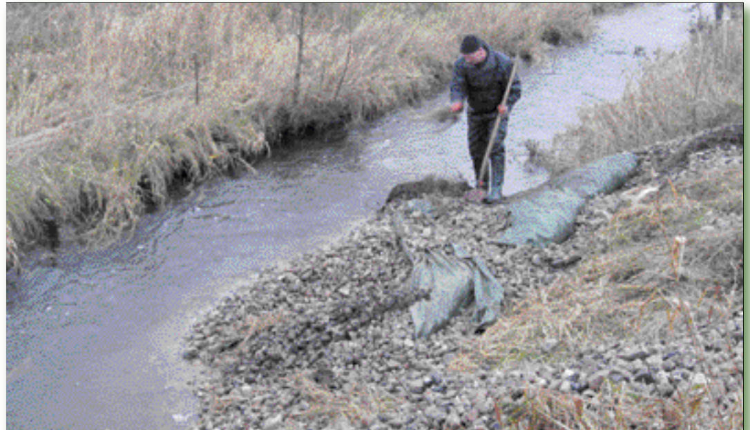
Durch Vererdung des Flussbettes erhöht sich die Fließgeschwindigkeit des Wassers.

Bei dem Informationsgespräch bezüglich der diesjährigen Elektrofischerei mit dem Vorsitzenden des Wasser- und Bodenverbandes wurde über unseren Wunsch, Laichbetten