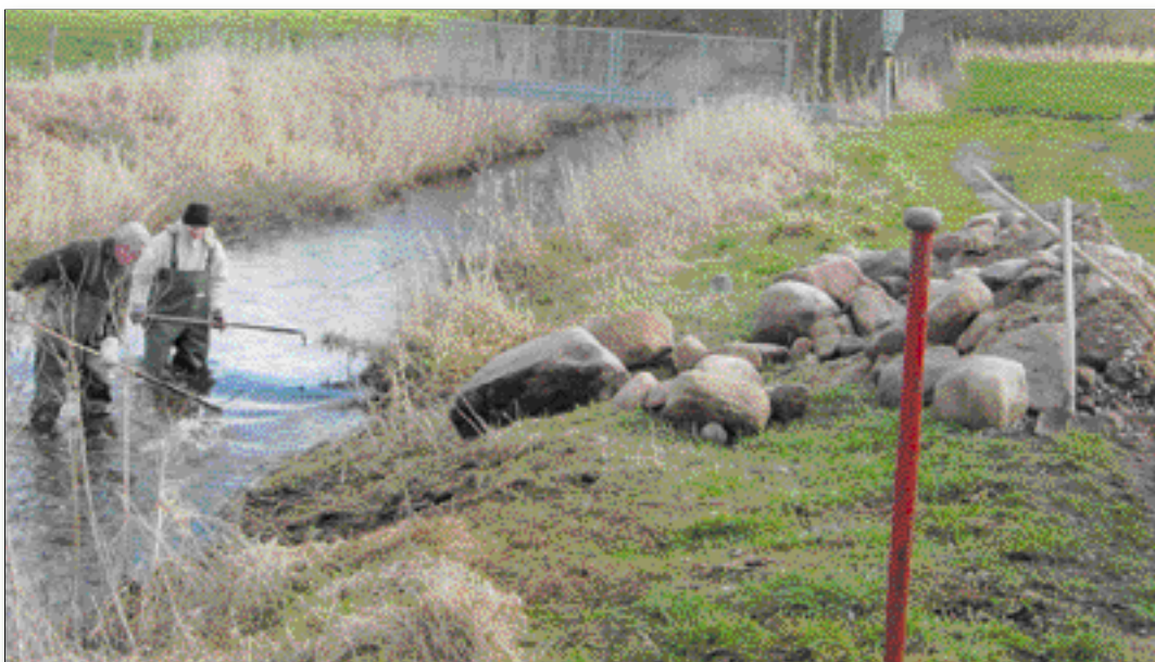
Große Findlinge wurden in das Flussbett der Bokeler Au eingebracht.

Der noch amtierende WBV Vorsteher hatte sich am Nachmittag ein Bild von der Maßnahme gemacht. Er war sehr mit den ausgeführten Arbeiten zufrieden und sicherte