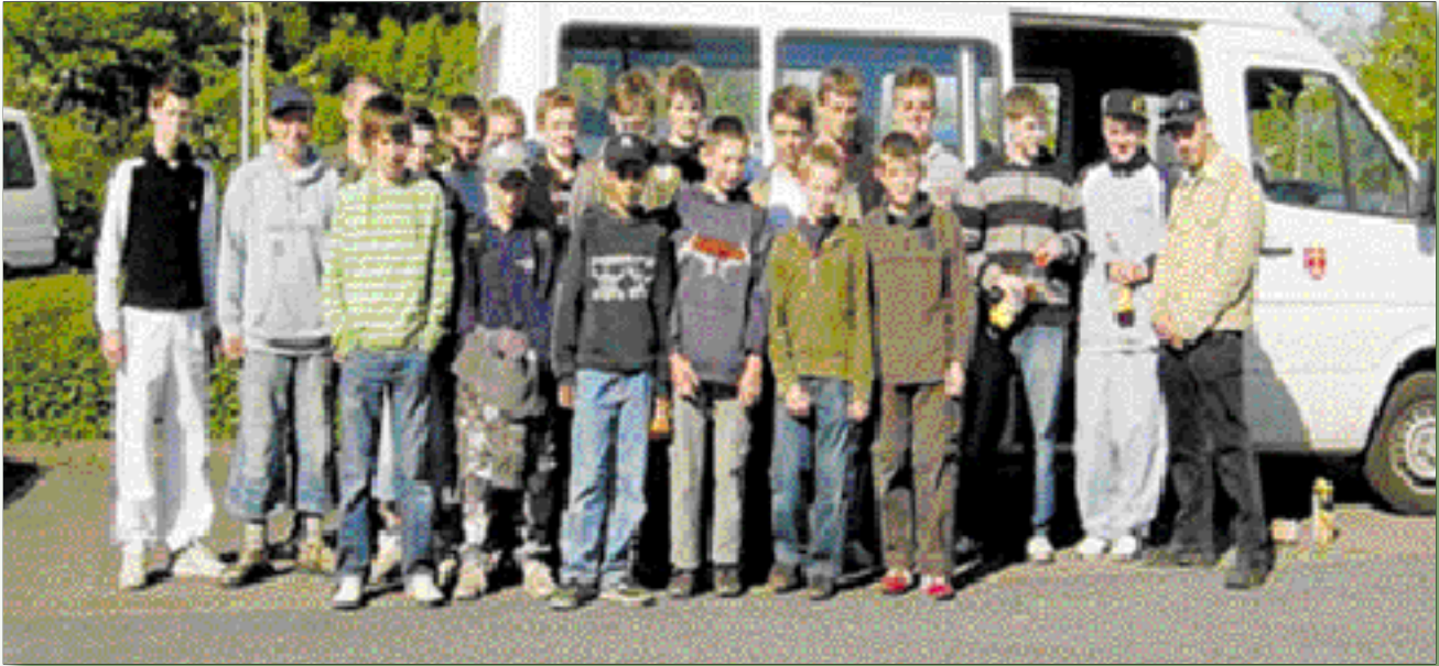
Hatte in Dänemark eine schöne Zeit und viel Spaß: Die Jugendgruppe des ASV Quickborn.