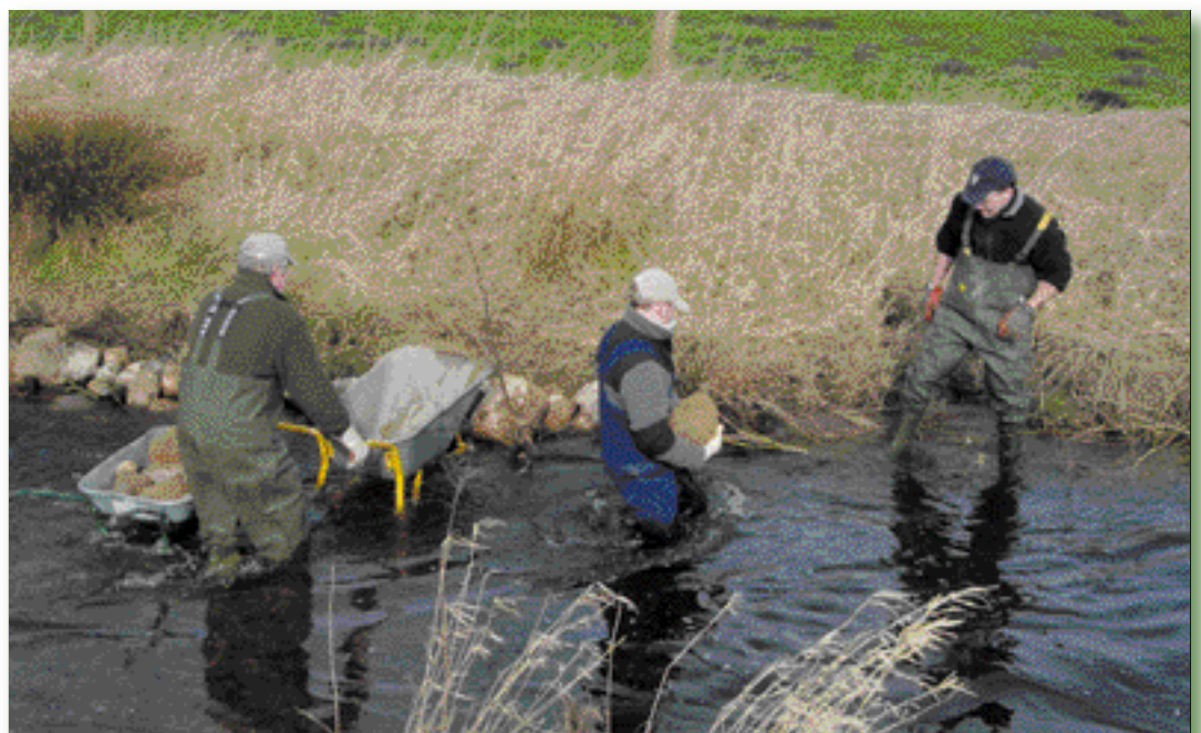
Harte Arbeit zum Wohlergehen für die Fische: Die Angler spuckten kräftig in die Hände.

Am 1. April konnten wir 90.000 Meer- und 60.000 Bachforellenbrütlinge in unser Gewässer setzen. Die Arbeit hat sich aus unserer Sicht mal wieder gelohnt.