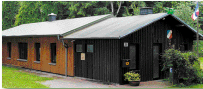
Das Vereinsheim wurde erst vor fünf Jahren wieder aufgebaut. Es wurde zuvor durch ein Feuer, das durch Brandstiftung entstand, zerstört.

Seit 1925 ist der Schöhsee schon das Angelrevier des Clubs mit seinen heute etwa 60 Mitgliedern. „Eine gute Mischung aus sinnvoller Freizeit und gemeinsamen Pflichten füllen unser Anglerjahr aus“,