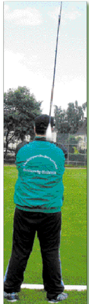
Der Wurf über den Kopf ist eine Variante.

LSFV-Referent für Meeresfischen & Turnierwurfsport