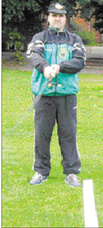
Der Seitenwurf Links kann wie die Varianten Rechts geworfen werden.

Das Zielwerfen beim Binnenfischen unterscheidet sich in vielerlei Hinsicht vom Meeresfischen. Die Rute darf eine Länge von 2,10 bis 2,75 Meter